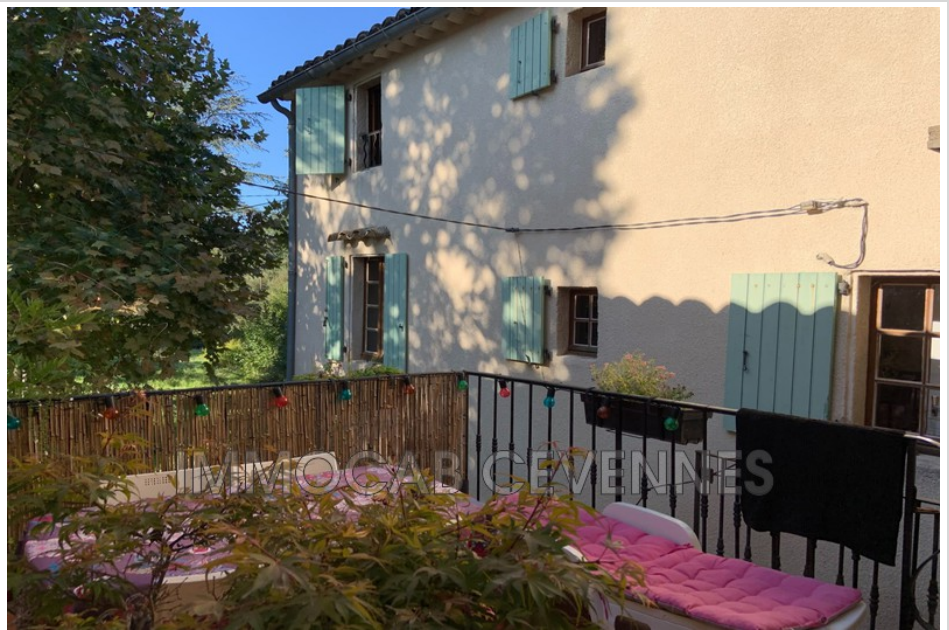
Mas 589 Anduze

ANDUZE SECTOR. Hamlet farmhouse on a plot of